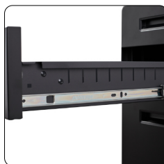
Leichtes Herausnehmen der Schubladen