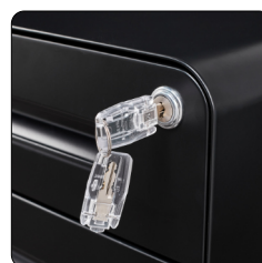
Zylinderschloss inkl. 2 Schlüssel