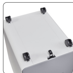
Einfaches Stecksystem zur Befestigung der Rollen